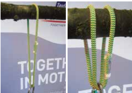
pic. 1: Single loop

This anchor device can be used in single strand or double strand configuration: