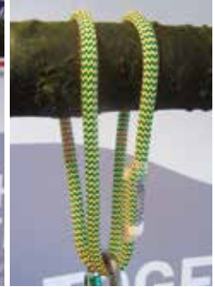
Abb. 2: als Doppelschlinge