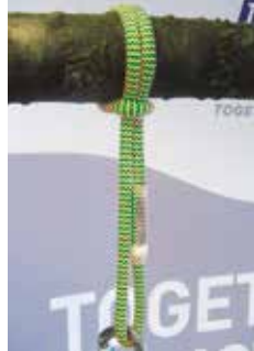
Abb. 3: als Würgeschlinge

Der Sirius Loop 10mm P-S (Art.Nr. 7351152) bzw. Sirius Loop 10mm P-L (Art.Nr. 7351151) ist Ersatzteil des Teufelberger pulleySAVER. Er kommt dort als Prusik zum Einsatz. Zur korrekten Montage konsultieren Sie bitte die Herstellerinformation des pulleySAVER.