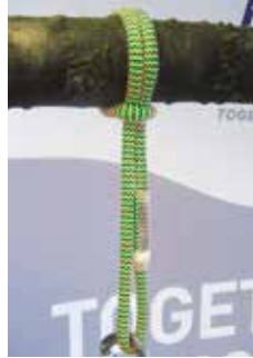
pic. 3: Constriction loop

Sirius Loop 10mm P-S (art. no. 7351152) and Sirius Loop 10mm P-L (art. no. 7351151), respectively, are replacement parts of Teufelberger's pulleySAVER. In this case, they are used as prusik loops. For detailed information on how to mount it properly, please consult the Manufacturer's Information document provided with the pulleySAVER.